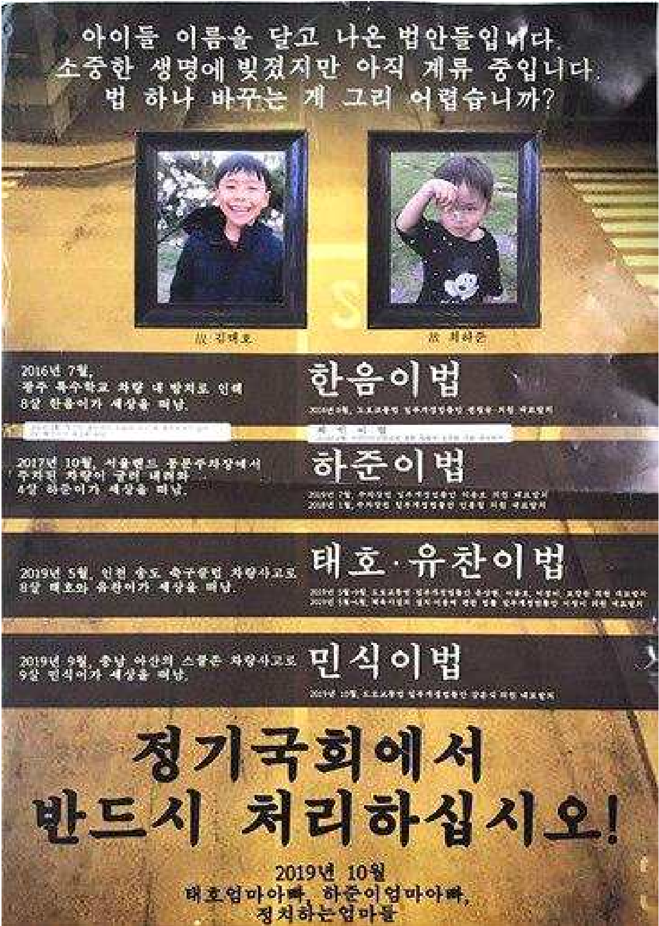
별첨 1. 동의서와 함께 의원실에 전달한 포스터